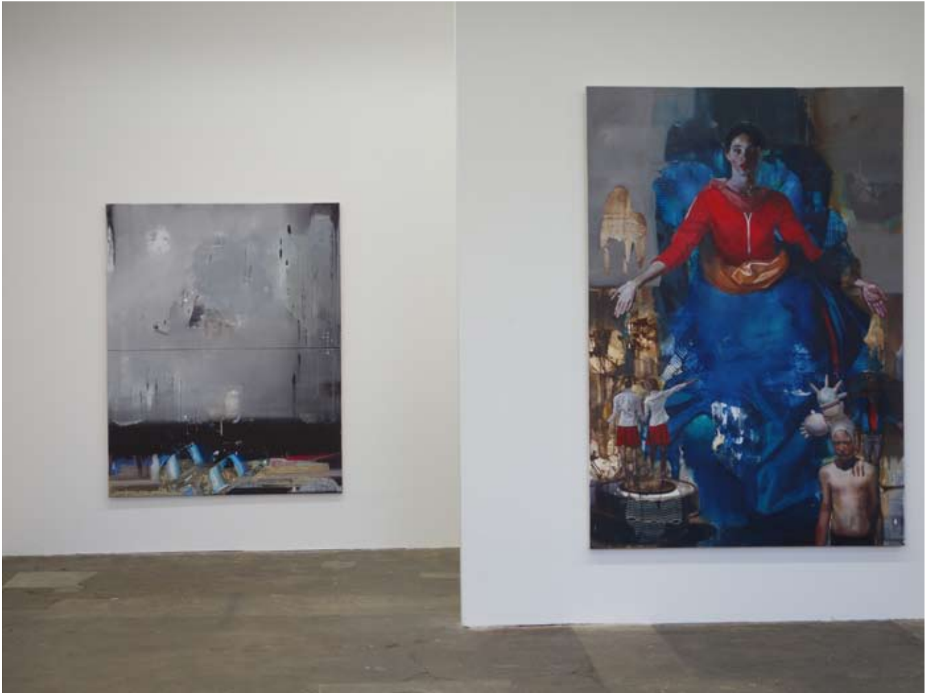
Krieger & Heilige #2 | Archiv Massiv, Spinnerei Leipzig – installationview