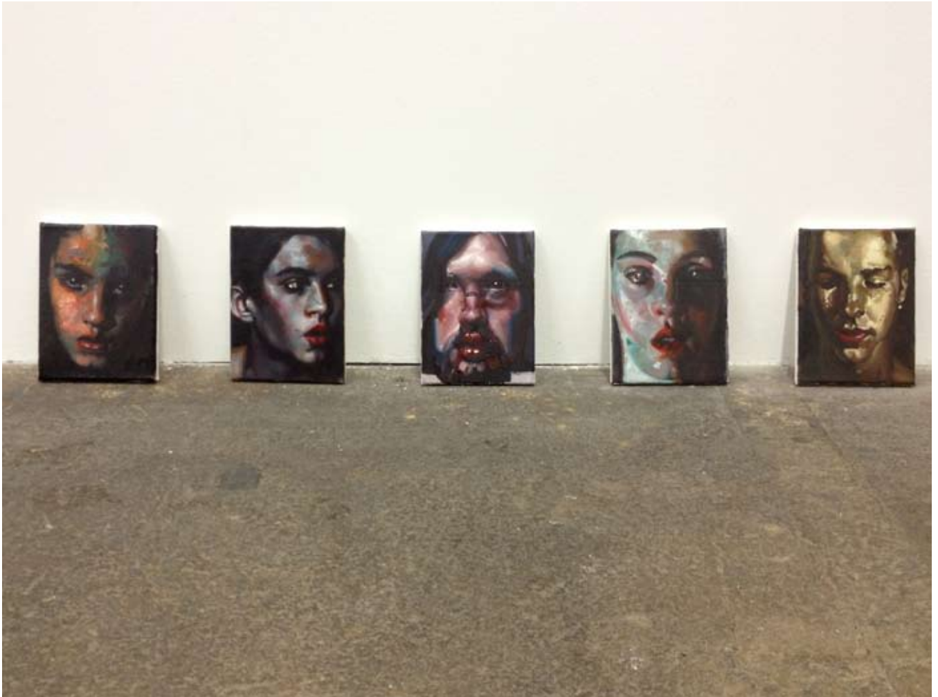
portrait n°1-5 | oil on canvas | each 24 x 18cm | 2011-2012