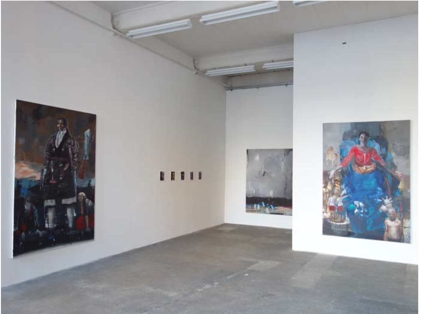
Krieger & Heilige #2 | Archiv Massiv, Spinnerei Leipzig – installationview