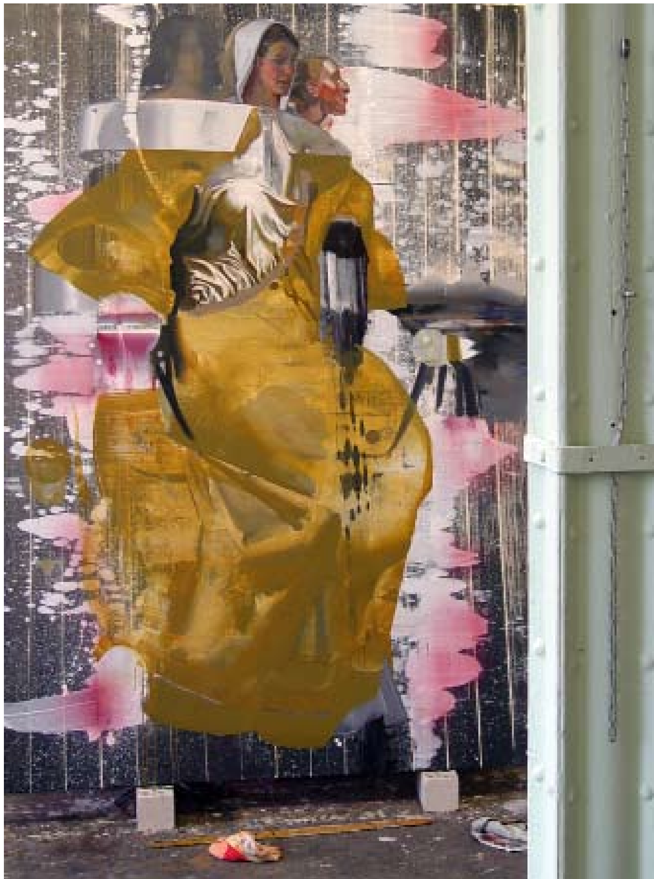
Erscheinung 2 | acrylic, oil on canvas | 260 x 180cm | 2012