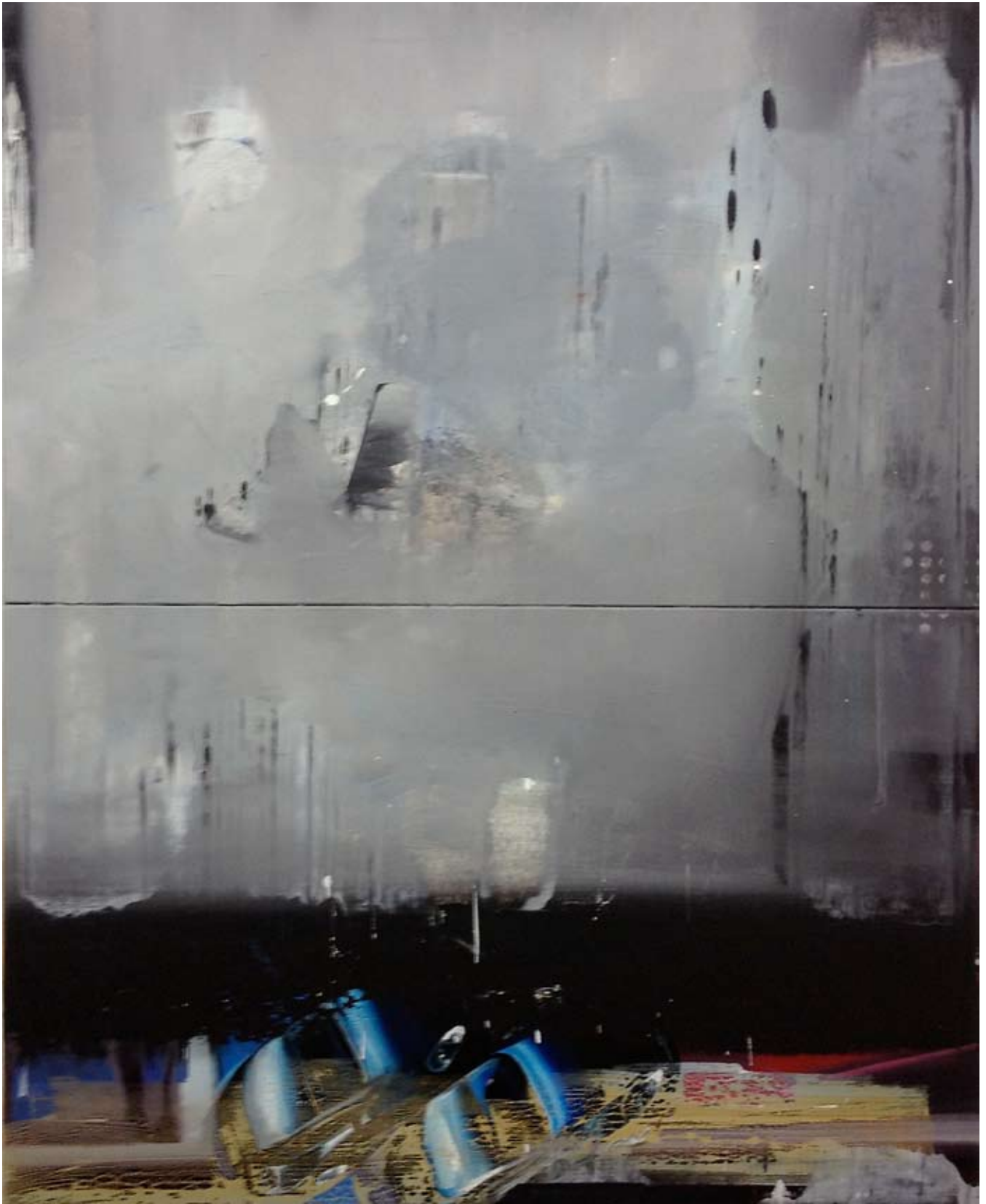
Brenneke | acrylic, oil on canvas | 220 x 175cm | 2012