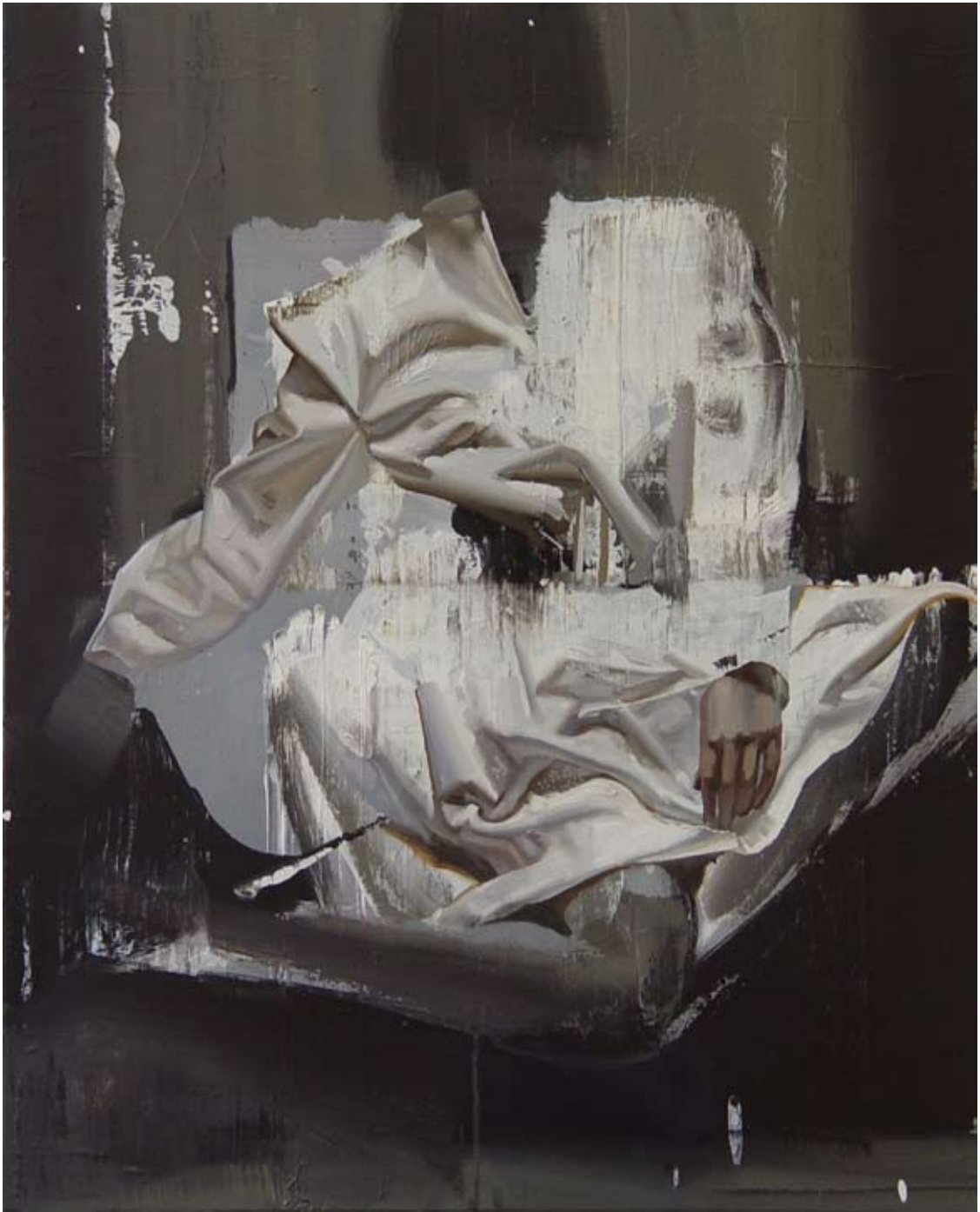
Schneewittchen | acrylic, oil on canvas | 100 x 80cm | 2012