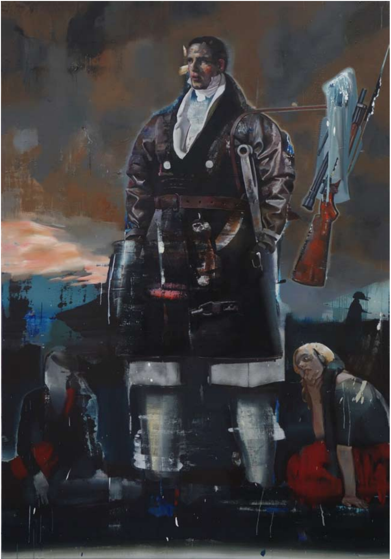
Wächter | acrylic, oil on canvas | 260 x 180cm | 2012