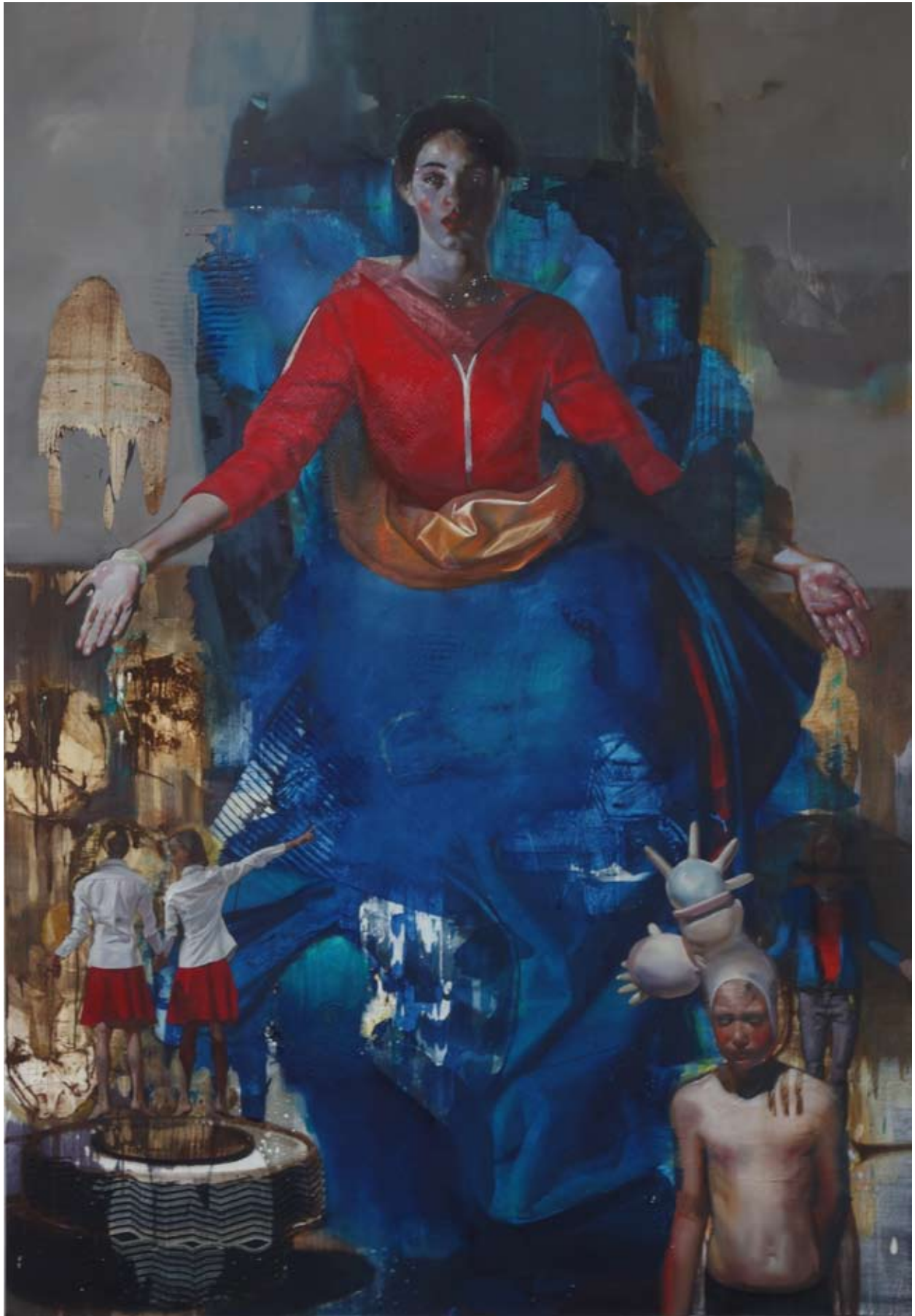
Maria voll der Gnaden | acrylic, egg, oil on canvas | 260 x 180cm | 2012