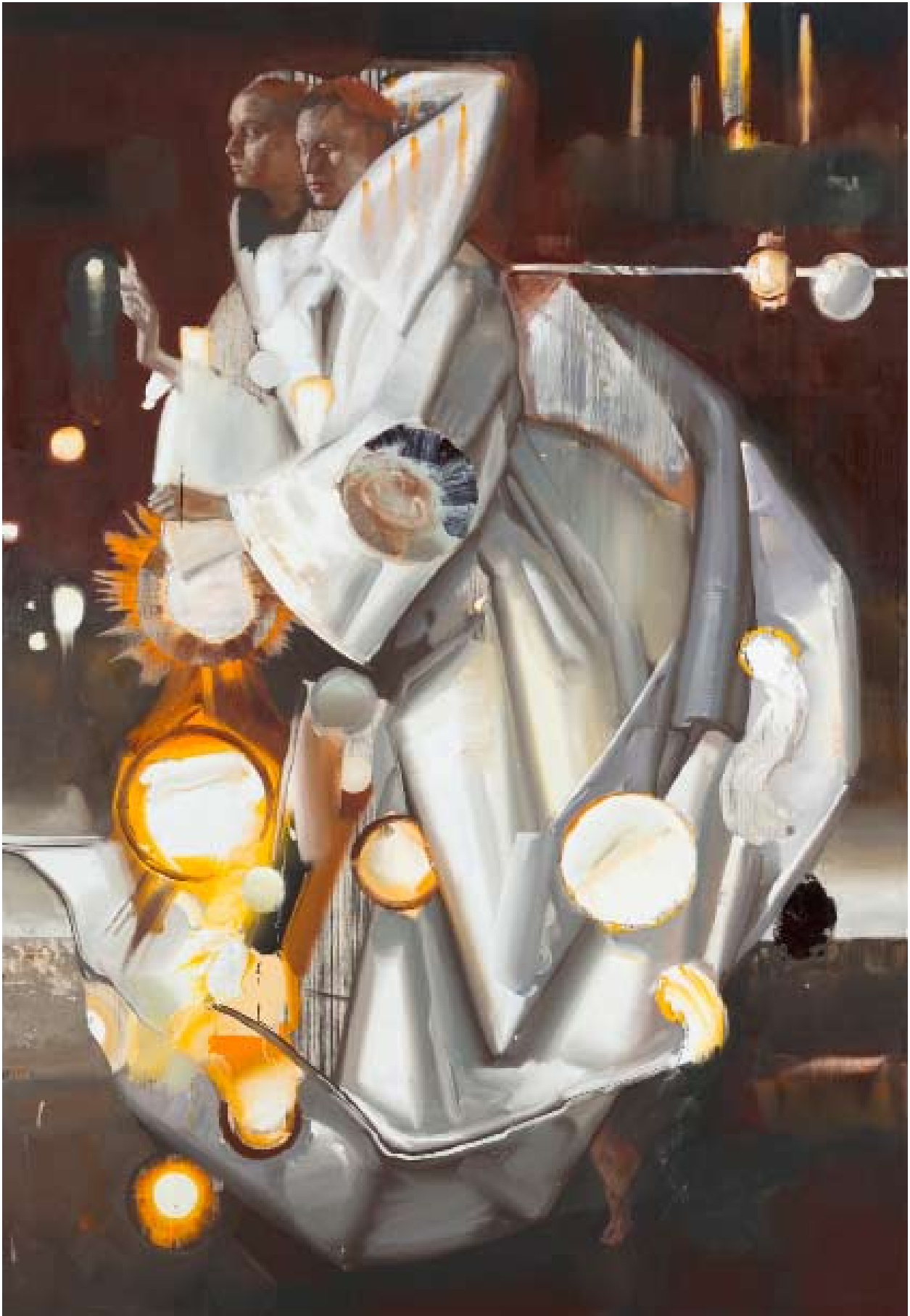
Erscheinung | acrylic, oil on canvas | 260 x 180cm | 2012