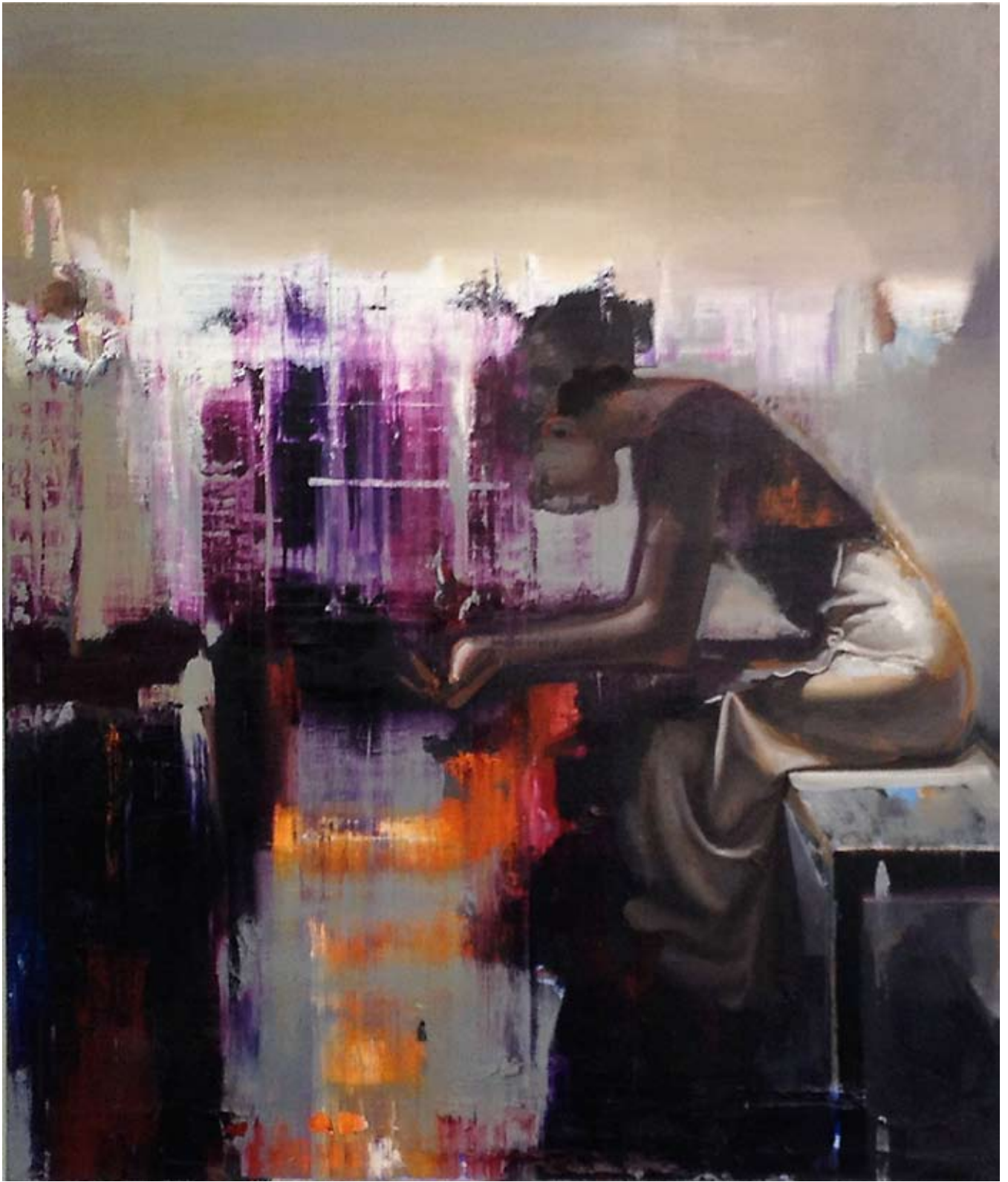
Kriegerin | oil on canvas | 140 x 120cm | 2012