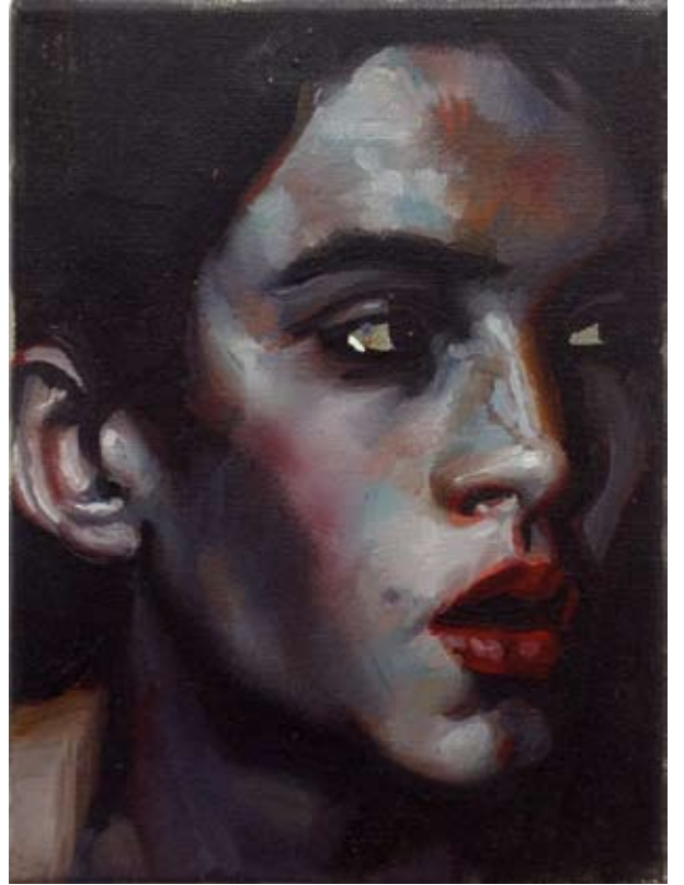
portrait n°2 & n°5 | oil on canvas | each 24 x 18cm | 2011